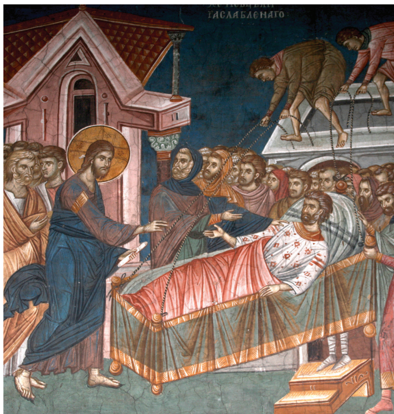
Исцеление расслабленного. Сербия. Дечаны. XIV в.

— Расслабленный «не имел человека», который помог бы ему спуститься в купель. В жизни каждого из нас может настать такое время, когда рядом не окажется никого.