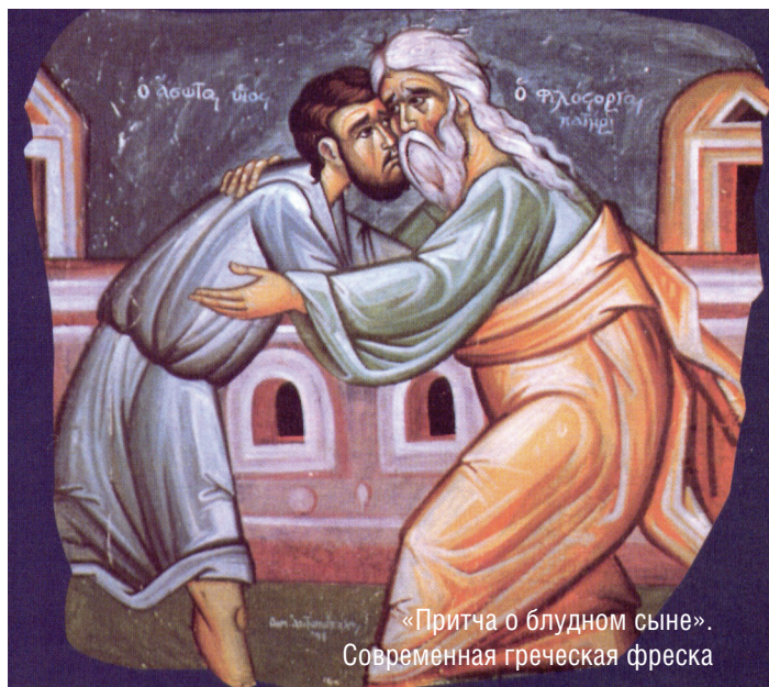
«Притча о блудном сыне». Современная греческая фреска

Мы не фундаменталисты и не экуменисты. Мы православные христиане, уравновешенные люди, любим весь мир, молимся за весь мир на Литургии. Не нам судить мир – Бог будет его судить. Для нас гибель хотя бы одного существа – мука. Мы не хотим, чтобы хотя бы один человек исчез от лица Божия. Мы любим всех людей. Знаете, я видел это на Святой Горе, где существуют особенно строгие правила. Можно сказать, что святогорцы исключительно привязаны к догматам веры и Преданию. Есть