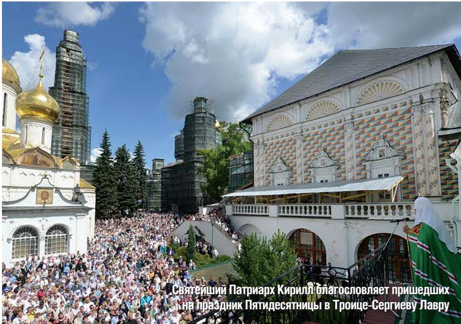
Святейший Патриарх Кирилл благословляет пришедших на праздник Пятидесятницы в Троице-Сергиеву Лавру

● Издание Восточного викариатства г. Москвы ● №26 (026) ● 08-14 июня 2014 года ● www.vostokvk.ru ●