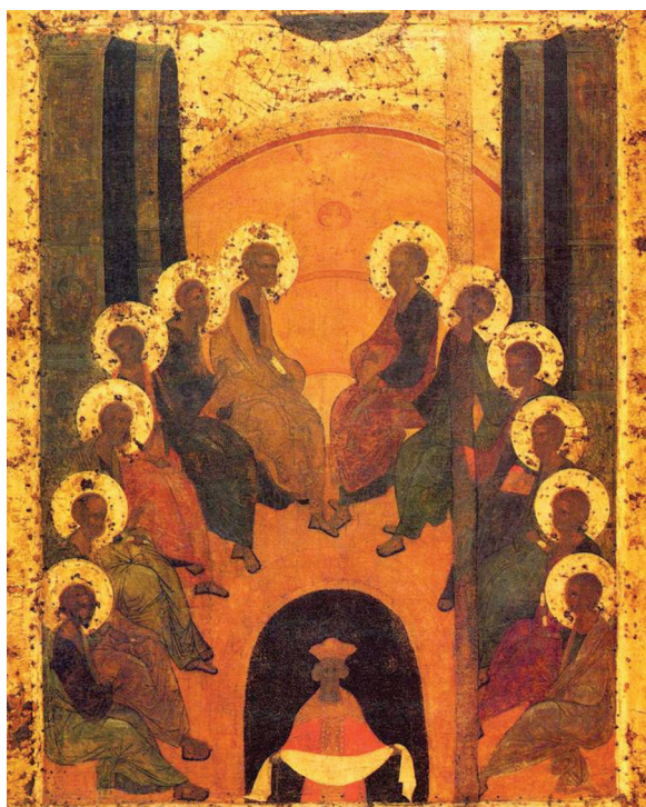
Сошествие Святого Духа на апостолов. Икона письма прп. Андрея Рублева из иконостаса Троицкого собора Троице-Сергиевой лавры. Начало XV в.