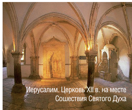
Иерусалим. Церковь XII в. на месте Сошествия Святого Духа

А постол Петр был простой рыбак. Господь, призывая его к служению апостола, предсказал, что отныне он будет «ловцом человеков». Об этом упоминает тропарь.