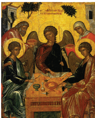
Троица. Греция. XVII в.

При наступлении дня Пятидесятницы все они были единодушно вместе. И внезапно сделался шум с неба, как бы от несущегося сильного ветра, и наполнил весь дом, где они находились. И явились им разделяющиеся языки, как бы огненные, и почили по одному на каждом из них. И исполнились все Духа Святаго, и начали говорить на иных языках, как Дух давал им