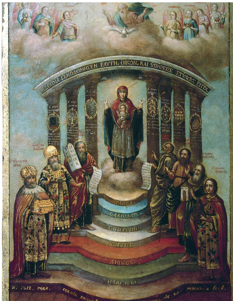
Икона «София Премудрость Божия», Греция XVIII-XIX вв.

Сегодня паремии читаются на вечерне или на всенощном бдении накануне Господских и Богородичных праздников, а также дней памяти великих святых. Есть паремии апостолам, святителям, преподобным, мученикам, праведным.