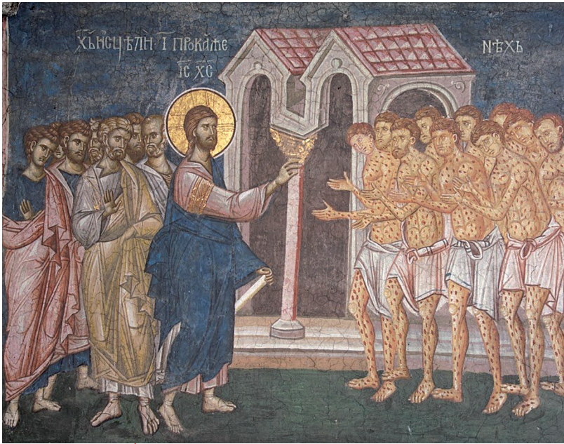
Исцеление десяти прокаженных. Фреска. Монастырь Сучевица, Румыния. XVII в.

Идя в Иерусалим, Он проходил между Самариєю и Галилеєю. И когда входил Он в одно селение, встретили Его десять человек прокаженных, которые остановились вдали и громким голосом говорили: Иисус Наставник! помилуй нас. Увидев их, Он сказал им: пойдите, покажитесь священникам. И когда они шли, очистились. Один же из них, видя, что исцелен, возвратился, громким голосом прославляя Бога, и пал ниц к ногам Его, благодаря Его; и это был Самарянин. Тогда Иисус сказал: не десять ли очистились? где же девять? как они не возвратились воздать славу Богу, кроме сего иноплеменика? И сказал ему: встань, иди; вера твоя спасла тебя.