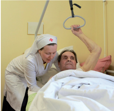
Группа милосердия будет опекать больных ПНИ № 5