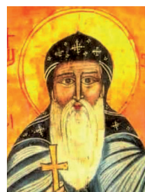
МАКАРИЙ ВЕЛИКИЙ (IV В.)

‘ Молиться надо так, чтобы ум был весь собран. И если ты сам не слышишь своей молитвы (по рассеянности), как же ты хочешь, чтобы Бог услышал ее? ’