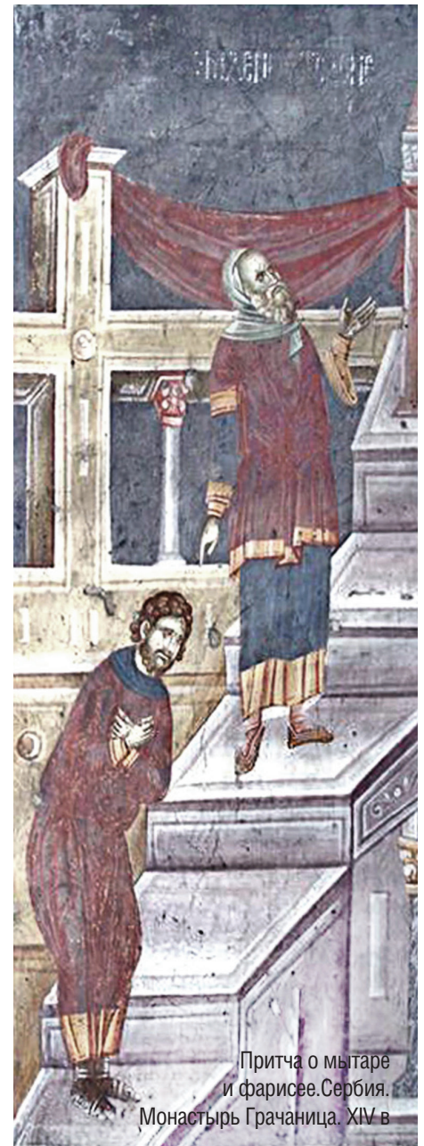
Притча о мытаре и фарисее. Сербия. Монастырь Грачаница. XIV в.

По церковнославянски воскресный день называется «неделя», а семь дней от воскресенья до воскресенья – «седмица». Например: «За Неделей о мытаре и фарисее следует сплошная седмица...» В переводе на современный язык это означает, что после воскресенья 9 февраля следует неделя без постных дней