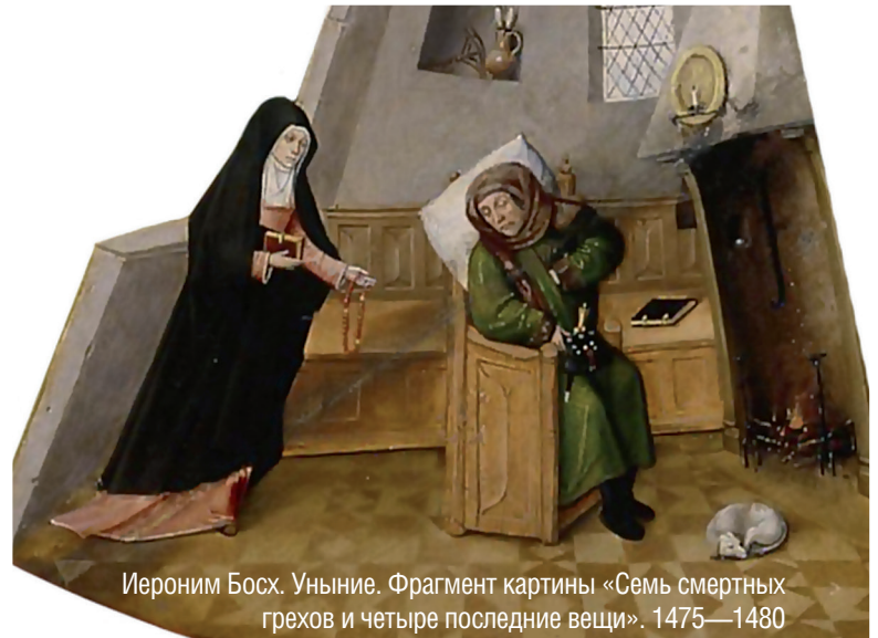
Иероним Босх. Уныние. Фрагмент картины «Семь смертных грехов и четыре последние вещи». 1475—1480

Часто люди говорят, что у них сложный характер и сделать ничего нельзя. На самом деле они просто скрывают нежелание работать над собой. Объясняет протоиерей Георгий Бреев