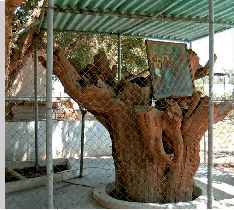
Дерево в Иерихоне, на которое залезал Закхей-мытарь

Потом Иисус вошел в Иерихон и проходил через него. И вот, некто, именем Закхей, начальник мытарей и человек богатый, искал видеть Иисуса, кто Он, но не мог за народом, потому что мал был ростом, и, забежав вперед, взлез на смоковницу, чтобы увидеть Его, потому что Ему надлежало проходить мимо нее. Иисус, когда пришел на это место, взглянув, увидел его и сказал ему: Закхей! сойди скорее, ибо сегодня надобно Мне быть у тебя в доме. И он поспешно сошел и принял Его с радостью. И все, видя то, начали роптать, и говорили, что Он зашел к грешному человеку; Закхей же, став, сказал Господу: Господи! половину имения моего я отдам нищим, и, если кого чем обидел, воздам вчетверо.