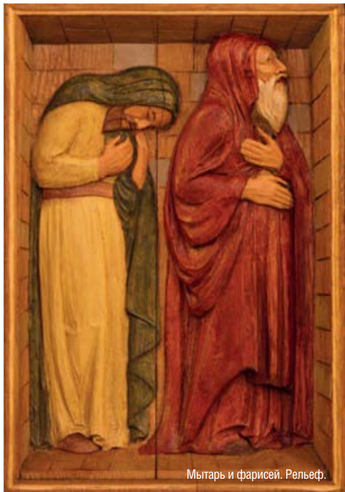
Мытарь и фарисей. Рельеф.

ЕВАНГЕЛИЕ ОТ ЛУКИ, ГЛАВА 18, СТИХИ 10-14: (читается на Литургии 9 февраля)